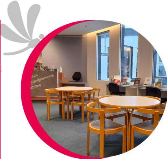
L'accueil de la section adulte