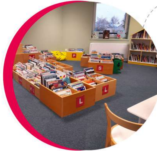
La section jeunesse, coin des albums et petits albums