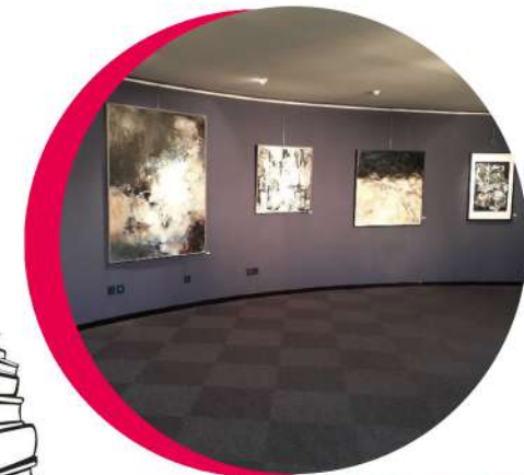
La salle d'exposition